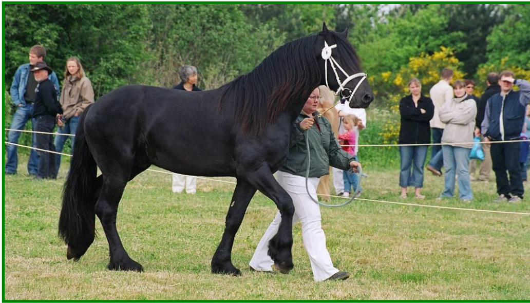
En ofte set fejl (mønsteren går foran hesten)